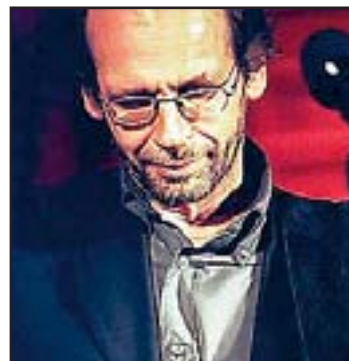
KOMMER: Ole Paus.