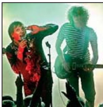
SPILLER: The Fernets.