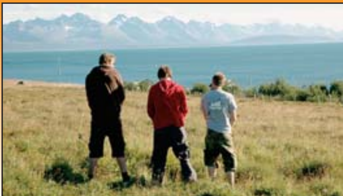
IDYLLISK: Må mann, så må mann.