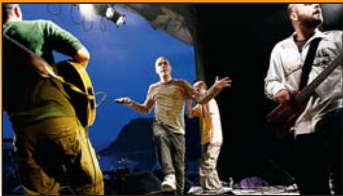
POPULÆRT: Svenska Akademien var på forhånd en favoritt for mange, og de leverte varene som forventet.