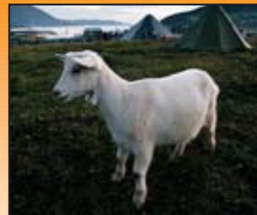
FESTIVALGEITA: Denne geita puslet rundt i teltområ- det.